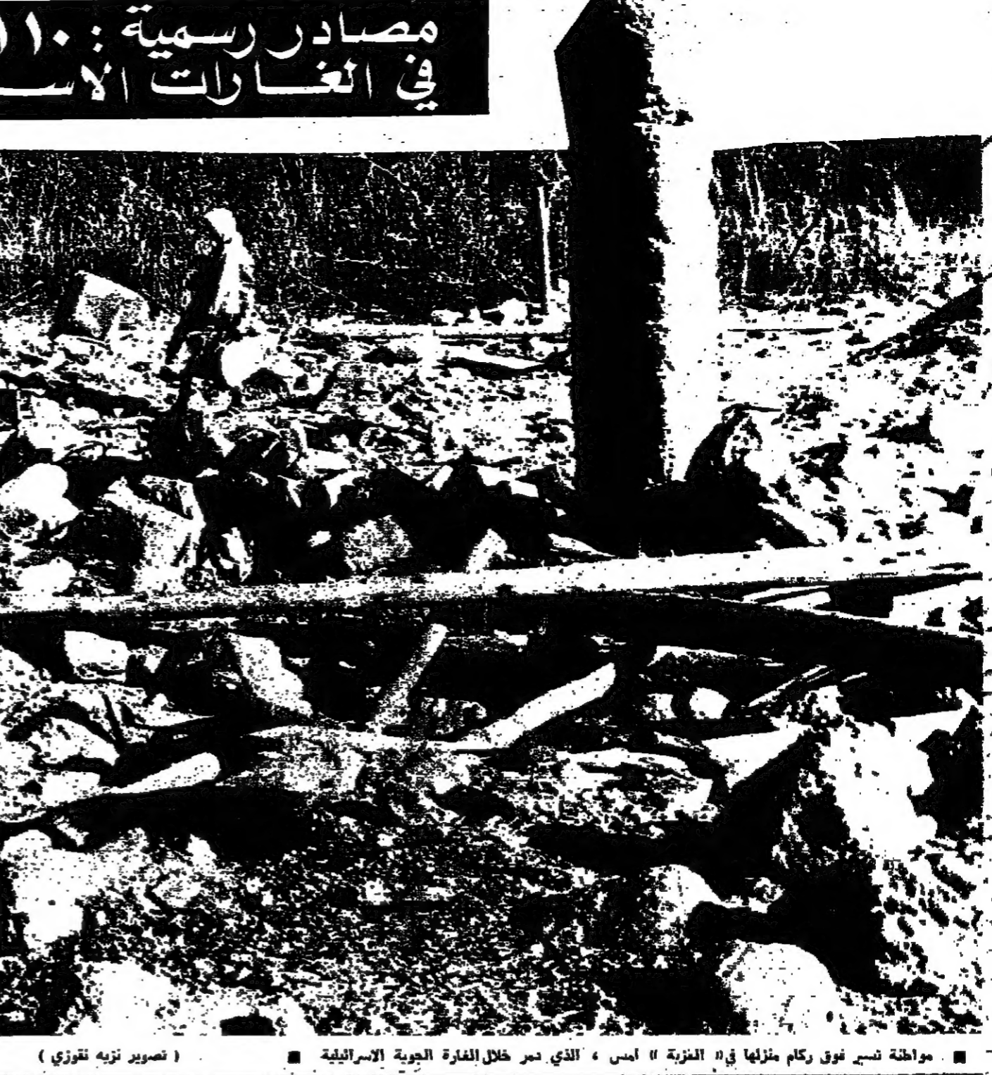
مواظرة تسير فوق ركام منزلها في «العزبة» أمس، الذي دمر خلال الغارة الجوية الإسرائيلية

اكدت مصادر رسمية في بيروت أمس ان عدد شهداء الغارات الجوية الإسرائيلية على جنوب لبنان يوم الأربعاء الماضي، يتوسع ان يتجاوز 11 شهيداً. وفي قرية «العزبة» وحدها ارتفع عدد الشهداء الى 6 شهداء معظمهم من النساء والاطفال اللبنانيين. وقد توجه عدد كبير من الراسلين الاجتباب الى «العزبة» أمس، حيث لم يبق غير اتمام من الركام والاشباب المحترقة. وقد هدمت قبائل المطارات الإسرائيلية كل بناء وسائنه بالاراضي. وكان هيكلاً محترقاً لسيارة قديمة ينسحب الى جانب كومة من الركام. وقال شاب لبناني ان السيارة لخاله الذي لا تزال جثته مذبذبة تحت الانقاض مع جثة زوجته، في مكان ما قرب السيارة. وعلى بعد خطوات قليلة، كان اقرباء الضحايا يتدفقون بخطر شديد قسبة كبيرة لم تنجز يبلغ وزنها 50 كيلوغراماً. وقد اصعبت ما خسرة كبيرة على الاقل يبلغ عمقها حوالي خمسة امتار. ويقترب وضعها القريب الى ان الطيارين الاسرائيليين قروا المنطقة بقذائف متناهية. ونشرت مصادر ارسال وكالة «رويترز»، انه على بعد بضعة كيلومترات من «العزبة» يوجد مخسر للتدخين في التلال قرب قرية ابو السود.